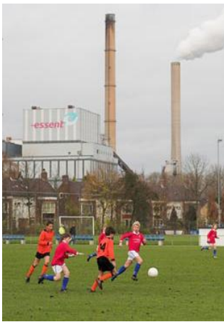
Foto: wonen, werken, recreëren en risico's.

Ten behoeve van fase 4 van het project Mal Groepsrisico zal in samenwerking met de landelijke beheerder worden bekeken of dit marketingplan moet worden bijgesteld.