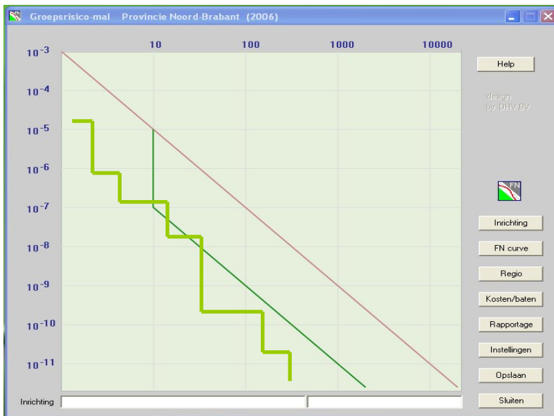
Afbeelding 1, voorbeeld van het hoofdscherm van de mal. De gepresenteerde drempelwaarde en groepsrisico zijn fictief.