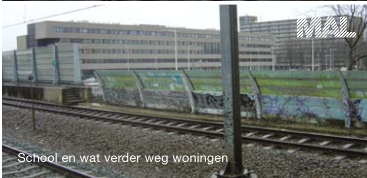
School en wat verder weg woningen

Een ziekenhuis, een school en woningen langs een spoorlijn die wordt gebruikt voor het vervoer van gevaarlijke stoffen. Drie situaties in Rotterdam-Zuid, waar verantwoording van het groepsrisico aan de orde is.